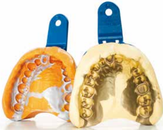
치과 인상재 dental impression material

한동안 충전제는 폴리머를 희석하기 위한 경제적인 재료 그 이상입니다. 충전제를 적용하면 폴리머 시스템의 특성을 의도적으로 변화시킬 수 있으며 특별한 요구 조건에 맞게 조정할 수 있습니다.